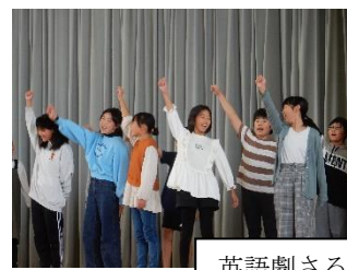
英語劇さるかにがっせん