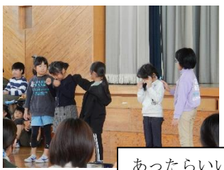
あったらいいな, こんなもの