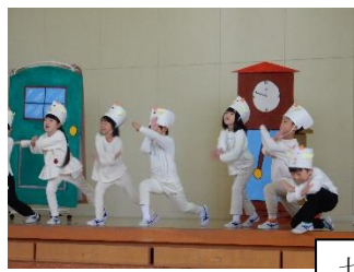
七ひきのおおかみと七ひきのこやぎ