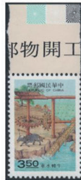
中華民国(台湾) 1995年 3.50ドル