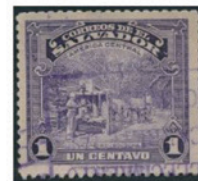
エルサルバトル 1938年 1セターボ