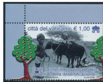
バチカン市国 2006年 1.00ユーロ