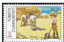
トルコ 1979年 5リラ