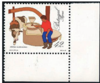
アゾレス諸島 1993年 42エスクード