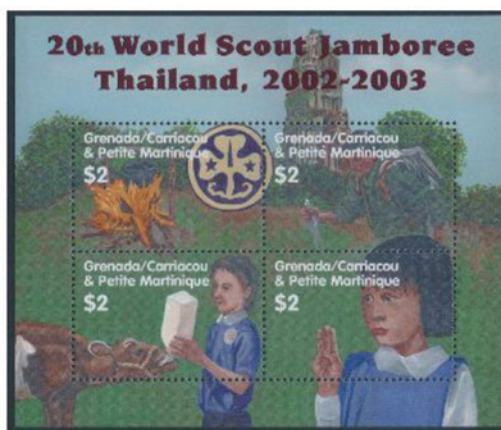
グレナダ領カリアク島プティマルティニーク島 2002年 2ドル×4 小型シート [×0.6]