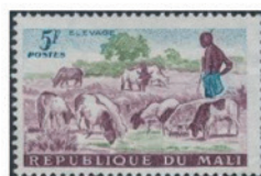
マリ 1961年 5CFAフラン