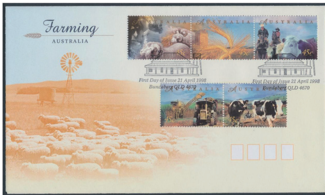
オーストラリア 1998 年 45 セント×5 初日カバー (FDC)