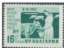
ブルガリア 1955 年 16 スティンキ