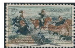
アメリカ 1964年 5セント