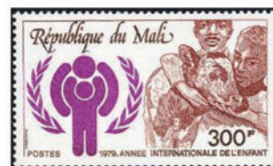
マリ 1979年 300CFAフラン