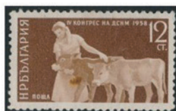
ブルガリア 1959 年 12 スティンキ