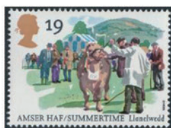
イギリス 1994年 19ペニー