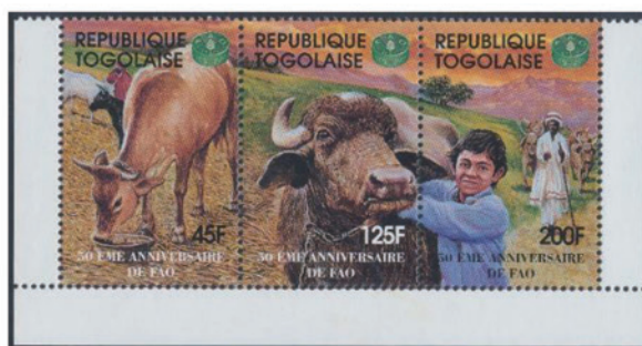
トーゴ 1995年 45・125・200CFAフラン 小型シート