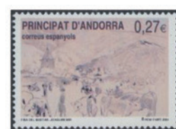
スペイン領アンドラ 2004年 0.27ユーロ