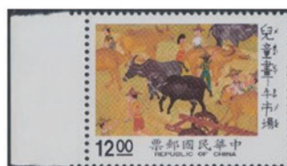
中華民国(台湾) 1990 年 12.00 ドル