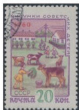
ソ連 1961 年 20 コペク