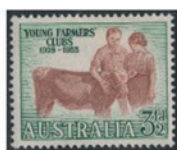
オーストラリア 1953 年 3 1/2 ペンス