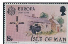
マン島 1981 年 8 ペンス