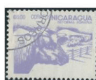
ニカラグア 1983年 6.00コルト・ハ