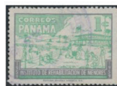
パナマ 1959年 1セティメ