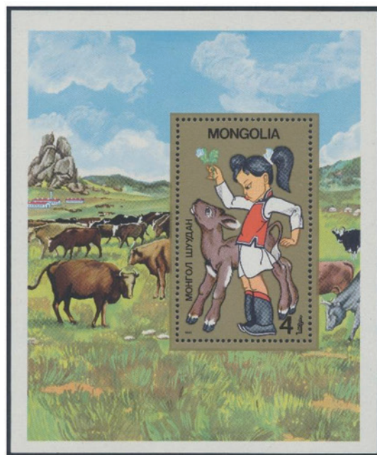
モンゴル 1985 年 4 トグ・ルグ 小型シート