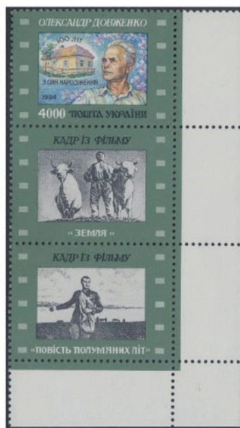
ウクライナ 1996 年 4000 コペカ、無額面×2