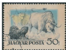
ハンガリー 1956 年 50 フロリン