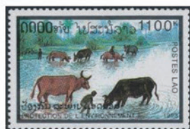
ラオス 1993 年 1100 キップ