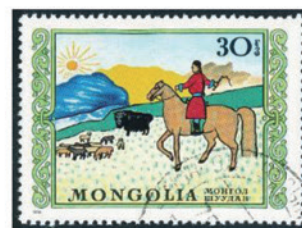
モンゴル 1976 年 30 モンゴ