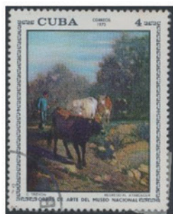
キューバ 1973年 4セターボ