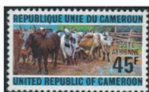
カメルーン 1974年 45CFAフラン