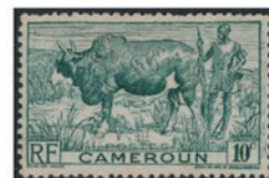
東カメルーン 1946年 10センチム