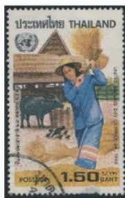
タイ 1984 年 1.50 バーツ