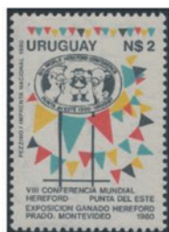
ウルグアイ 1980年 2ペソ