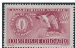
コロンビア 1957年 20セターボ