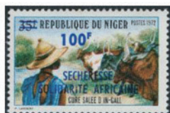
ニジェール 1972年 100CFAフラン