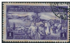
ソ連 1949 年 1ルブル