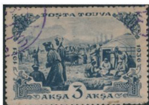
タンザニア 1936 年 3 シリング