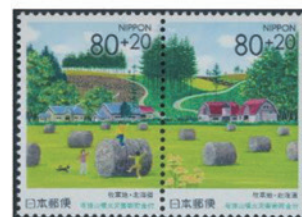
日本（牧草地） 2000 年（80+20 円）×2