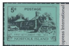
ノーフォーク島 1998 年 5 セント