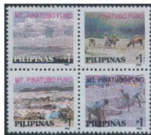
フィリピン 1992 年 1 ペソ×4