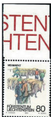
リヒテンシュタイン 1989 年 80 ラッペン