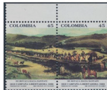
コロンビア 1989年 45ペソ×2