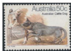
オーストラリア 1980 年 50 セント