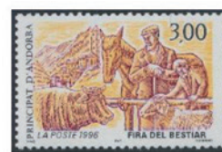
フランス領アンドラ 1996年 3フラン