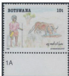
ボツワナ 1989年 10ペ