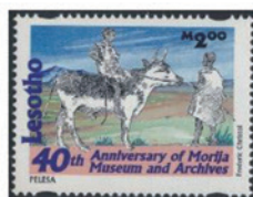
レソト 1998年 200マツ