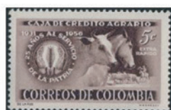
コロンビア 1957年 5セターボ