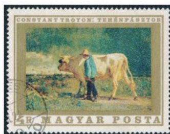
ハンガリー 1969 年 4 フロリン