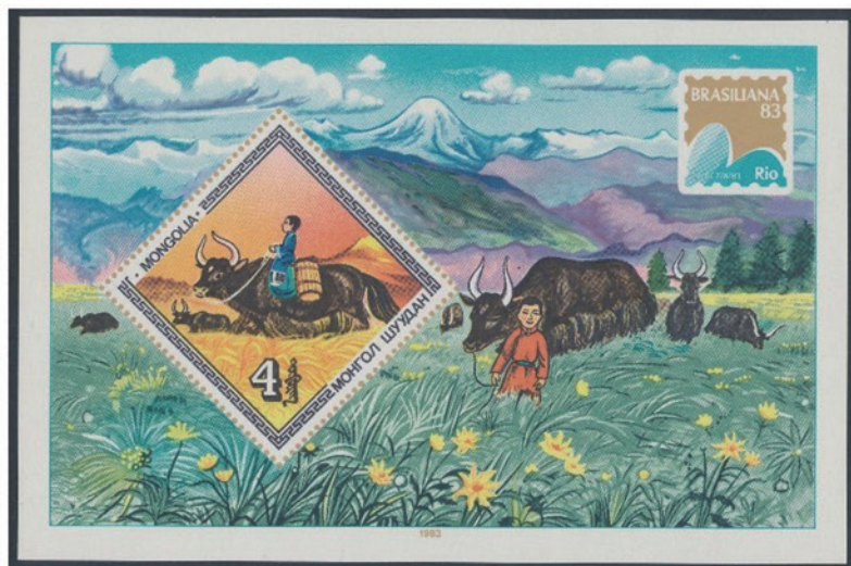
モンゴル 1983 年 4 トグ・ルグ 小型シート