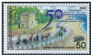
グルジア 2001年 50テリ