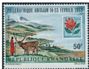
ルワンダ 1969年 50フラン