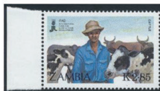
ザンビア 1988年 2.85クワチ