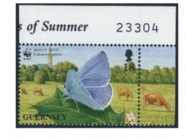
ガーンジー島 1997 年 18 ペニー