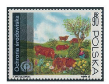
ポーランド 1973 年 90 グローシュ