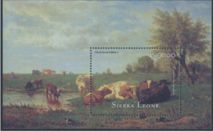
シエラレオネ 2001 年 5000 レオーネ 小型シート 〔×0.6〕