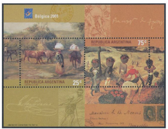
アルゼンチン 2001 年 25・75 センターボ 小型シート