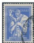
ギリシャ 1970年 2ドラム