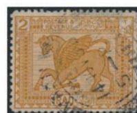
イラク 1923年 2ディナール