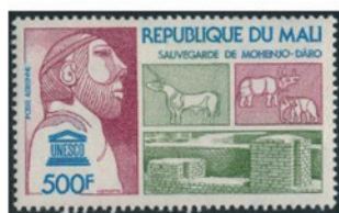
マリ 1976年 500CFA フラン