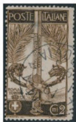
イタリア 1911年 2センチモ