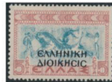
ギリシャ 1940年 5ドラム(加刷)