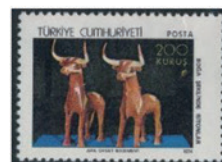
トルコ 1974年 200 クルシュ