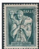
ギリシャ 1954年 2500ドラム