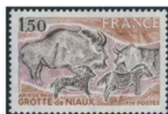
フランス 1979年 1.50フラン