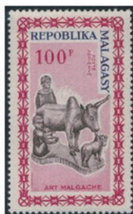
マダガスカル 1964年 100 フラン