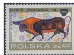
ポーランド 1976年 4.2ズロツ