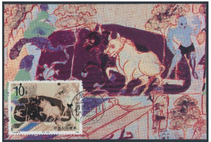
中国 1988 年 10 分 [×0.6]