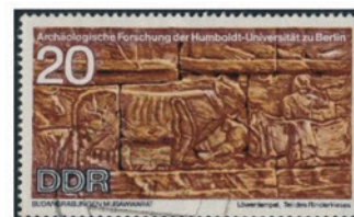
東ドイツ 1970年 20ペニ