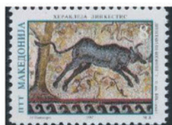
マケドニア 1997年 8デナール