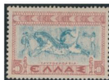
ギリシャ 1937年 5ドラム