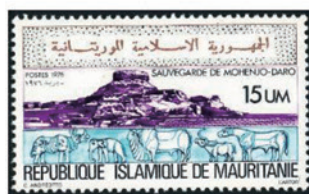
モーリタニア 1976年 15 ユム