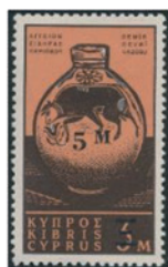
キプロス 1966年 5ミル