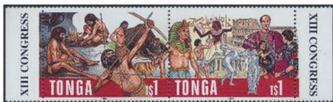
トンガ 1996 年 1 パ'アング ×2 [×0.65]