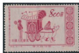
中国 1953 年 800 圓