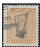
イラク 1963年 4・5・10 フィル