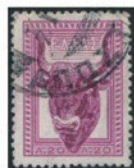
ギリシャ 1958年 20レプトン、200ドラム