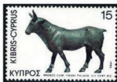
キプロス 1980年 15ミル