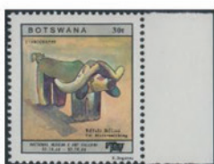
ボツワナ 1988年 30 テベ