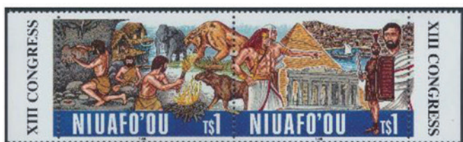
ニウアフォオウ島 1996 年 1 パ'アング ×2 [×0.65]