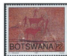
ボツワナ 1991年 8・15 テベ、2 プラ