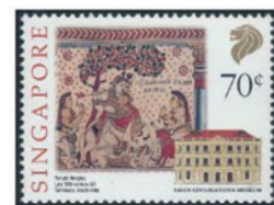
シンガポール 1996 年 70 セント