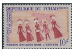
チャド 1968年 10CFA フラン