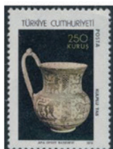
トルコ 1974年 250 クルシュ