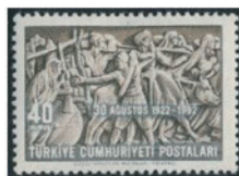
トルコ 1962年 40 クルシュ