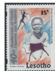
レソト 1998年 35 セント