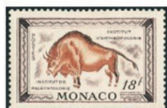
モナコ 1949年 18フラン