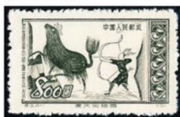
中国 1952 年 800 圓