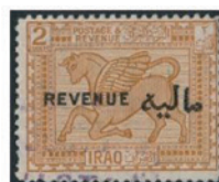
イラク 1923年 2ディナール(加刷)