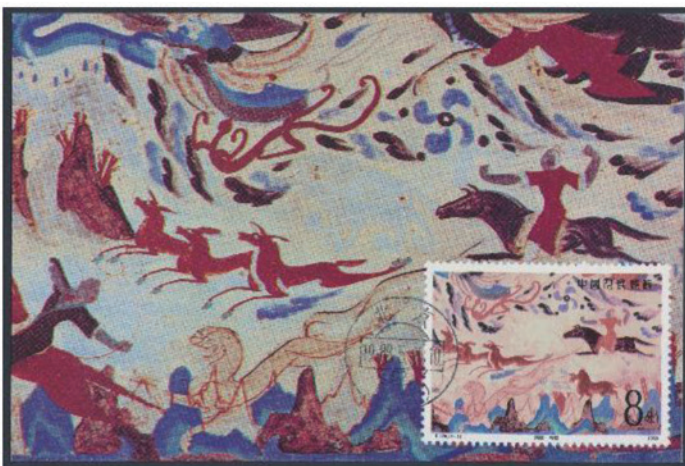
中国 1988 年 8 分 [×0.6]