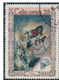
キューバ 1967 年 20 センターボ