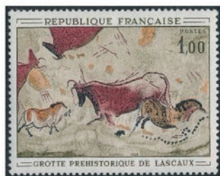
フランス 1968年 1.00フラン