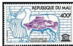
マリ 1976年 400CFA フラン