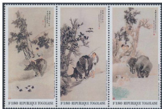
トーゴ 1997年 180CFAフラン×3