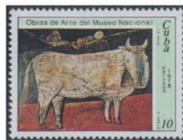
キューバ 1978年 10 センターボ