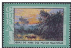
キューバ 1974年 3 センターボ