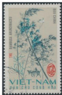
ベトナム 1967年 12・30 シュウ