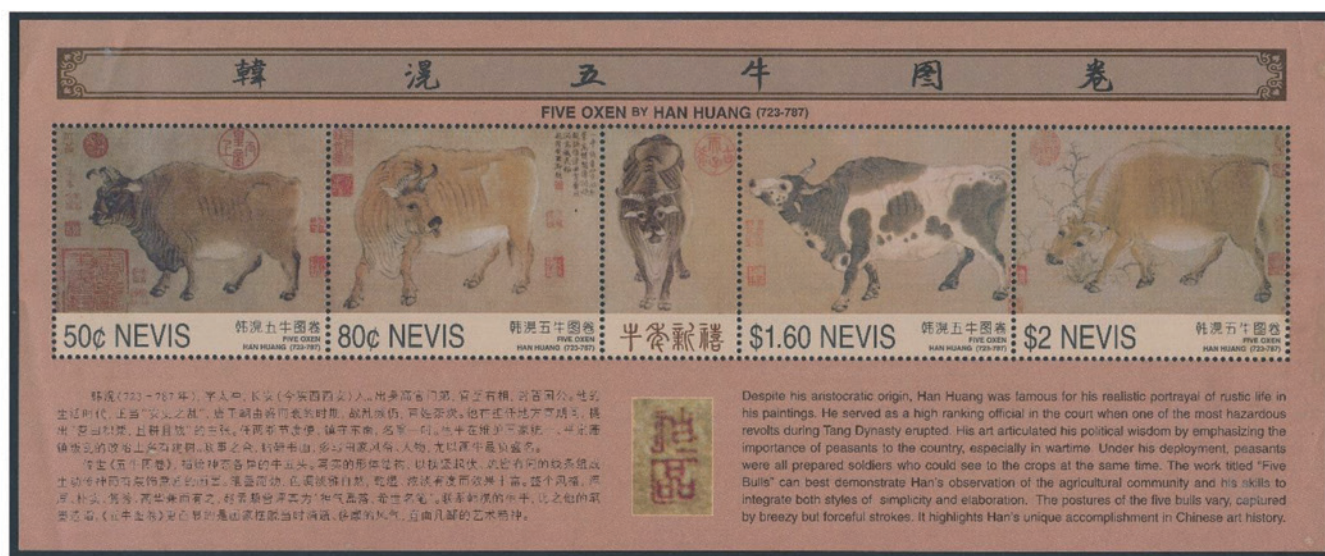
ネイビス 1997年 50・80セント、1.60・2ドル 小型シート