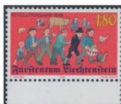
リヒテンシュタイン 1998年 1.80センチム