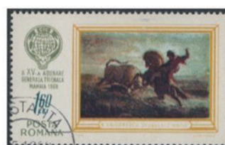
ルーマニア 1986年 1.60レイ