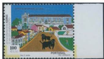
アゾレス諸島 1999年 100エスクド