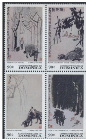
ドミニカ国 1997年 90セント×4