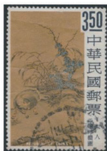
中華民国 (台湾) 1966年 3.50 ドル