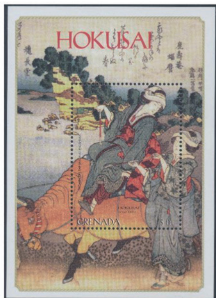
グレナダ 1999年 6ドル 小型シート