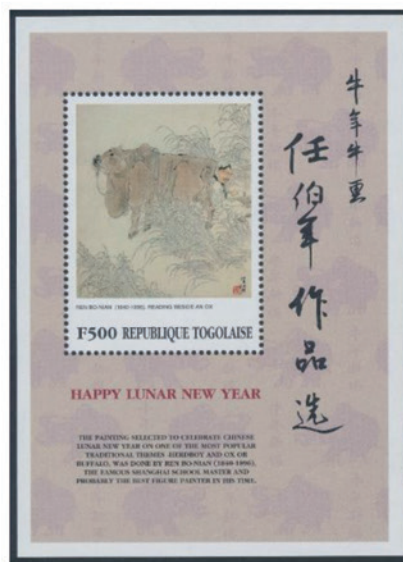
トーゴ 1997年 500CFAフラン 小型シート