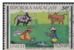
マダガスカル 1971年 50フラン