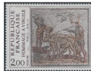
フランス 1981年 2.00フラン