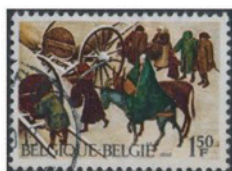
ベルギー 1969年 1.50フラン