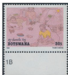
ボツワナ 1989年 30プーラ