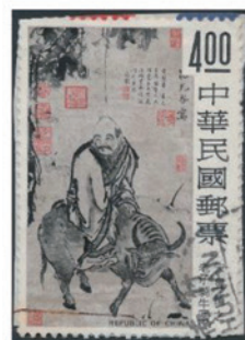
中華民国 (台湾) 1975年 4.00 ドル