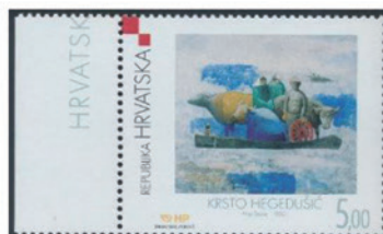
クロアチア 2002年 5.00クーナ