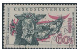
チェコスロバキア 1964 年 60 ハレル