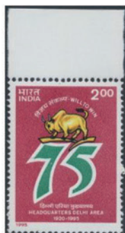
インド 1955年 2.00 牒