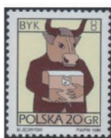
ポーランド 1996 年 20 グロシュ