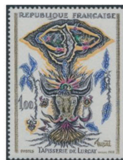
フランス 1966 年 1.00 フラン