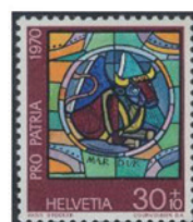
スイス 1970 年 30+10 センティム