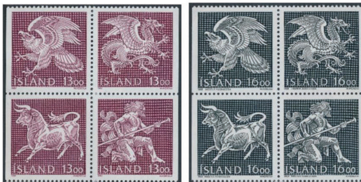
アイスランド 1990 年 13.00 クロナ×4、16.00 クロナ×4