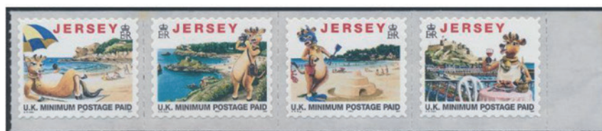
ジャージー島 2007 年 無額面×4