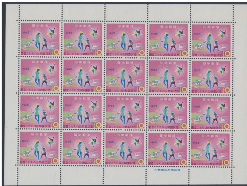
日本 1965年 10円 × 20 シート