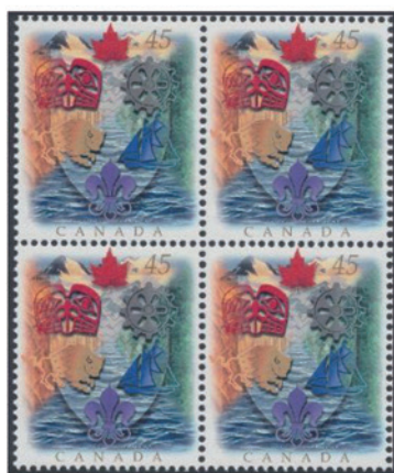
カナダ 1996 年 45 セント×4