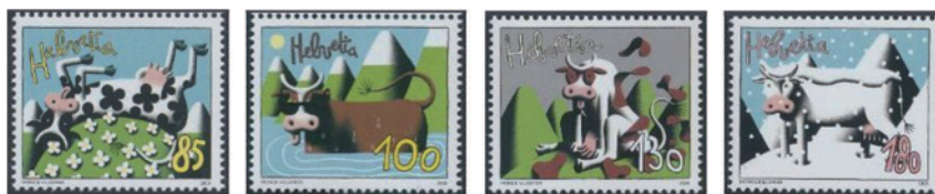
スイス 2006 年 85・100・130・180 センティム