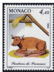
モナコ 1993 年 4.40 フラン