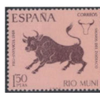
リオ・ムニ 1968年 1.50ペセタ