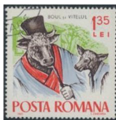
ルーマニア 1965 年 1.35 レイ