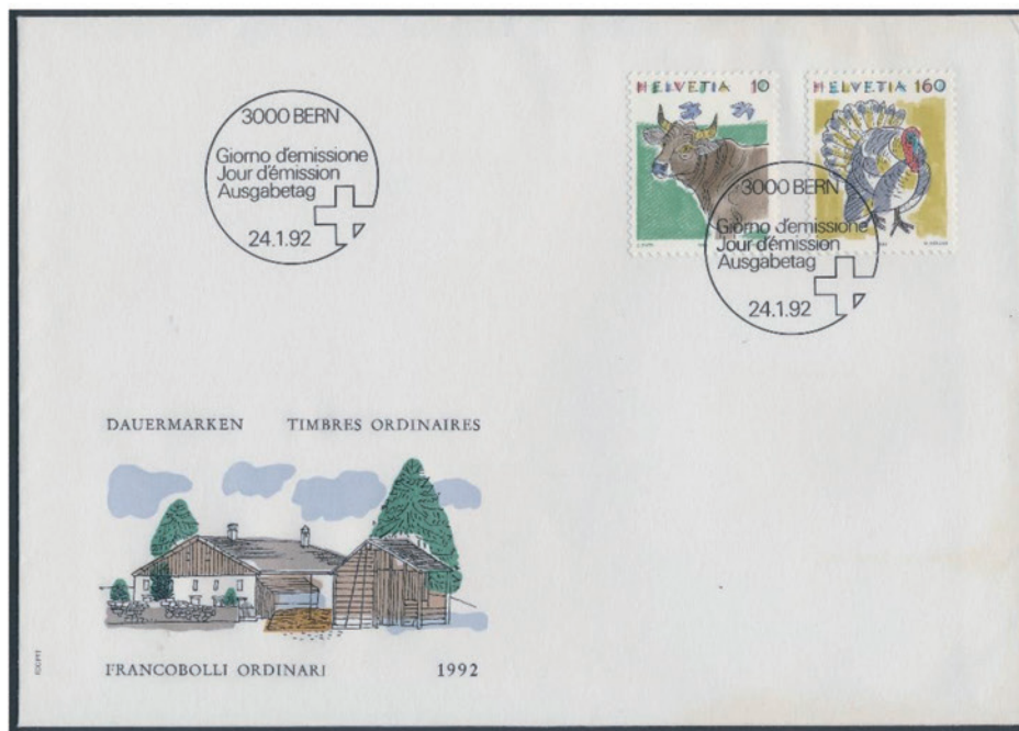
スイス 1992 年 10・160 センティム 初日カバー (FDC)