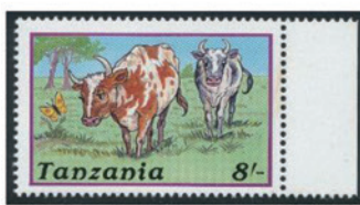
タンザニア 1988年 8シリング