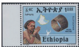
エチオピア 1988年 1ブル