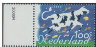
オランダ 1995 年 100 セント