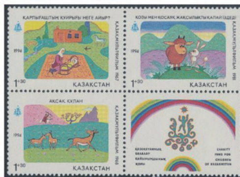
カザフスタン 1994年 1.30 テンゲ × 3、無額面