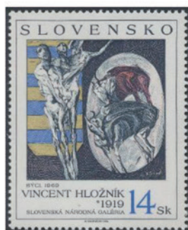
スロバキア 1994 年 14 コルナ