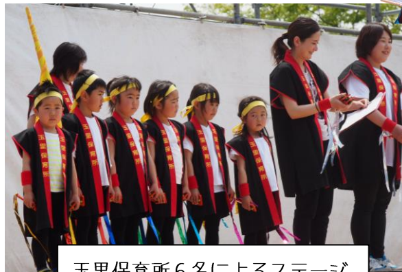
玉里保育所6名によるステージ