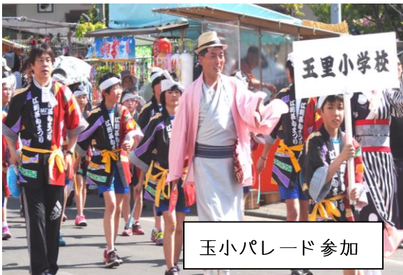
玉小パレード参加