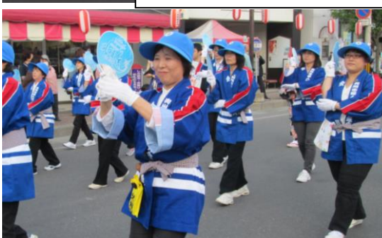
婦人消防協力会の皆さん