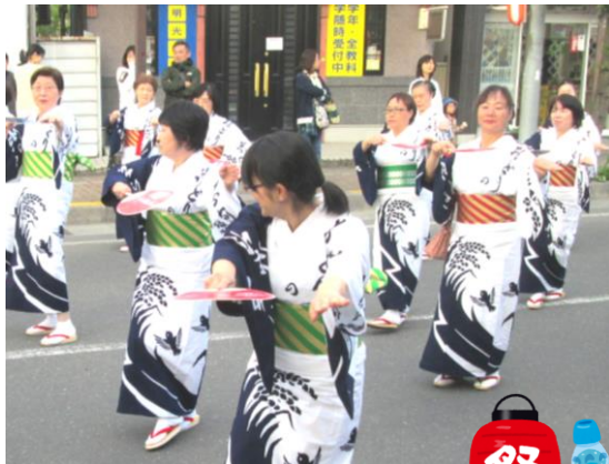
女性部の皆さん(4区)