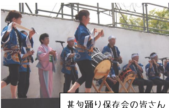
甚句踊り保存会の皆さん