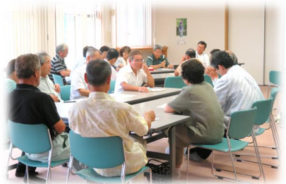
【グループ討議の様子】

8月1日、社会福祉協議会主催の「かたりあいの輪」が玉里地区センターで開催されました。懇談会では、「地域に必要な生活支援サービス」をテーマにグループ討議が行われました。それぞれ各グループで活発に意見交換がされる中で、生きがい・元気の居場所づくりに男性の参加しやすい集まりが少ない又は、情報が不足していて家にひきこもりがち等多くの課題があげられました。また、交通手段の確保も課題であり出かけたくても出かけられない高齢者への支援が欲しいと話題になりました。様々な解決の必要な課題があり、実現はまだまだ難しそうですが、これからの地域づくりについて話し合い意識の共有を図ることができたのではないのでしょうか。