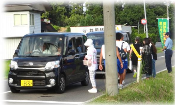
【信号待ちの車へ ハイ、どーぞ ♪】

8月5日、交通安全委員会と交通安全母の会は、青篠地内の交差点において、運転手にチューインガムを手渡し、交通安全を呼びかけました。暑くてもシートベルトをしっかりと締め、安全運転をお願いします。大変暑い中での活動でしたが、ご協力いただきました交通安全委員、母の会の皆さんお疲れ様でした。