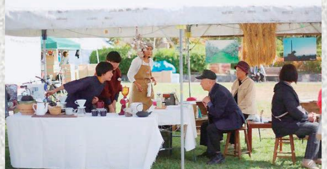
▲去年の産業まつりの様子です

10月12日、13日は水沢産業まつりが開催されます。昨年はWalk on Soilのメンバーとして、奥州の伝統工芸品の一つである南部鉄瓶を使ったお湯でハンドドリップコーヒーを入れ、皆さんと交流させていただきました。南部鉄瓶を見て「昔はうちにもあったな」