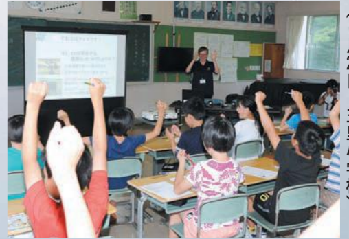
クイズを交えた授業の様子(6月26日・玉里小学校)

平成26年に中学校を対象として始まったこの取り組みは、平成27年から小学校にも対象を拡大。昨年度までの5年間で、延べ6000人余りの児童・生徒がILCについて学んできました。本号では、最近の小学校出前授業の様子をお伝えします。