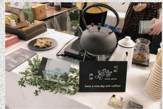
▲昨年12月には、台湾で行われたコーヒーイベントにも出店しました。南部鉄器で入れたコーヒーや自家製リンゴのドライチップで奥州をPRし、大好評でした

今年は、市地域おこし協力隊のみんなで準備をして、コーヒーだけではなく衣川のはと麦茶や台湾の高山茶もメニューに加えて出店します。休憩スペースもあり、カヌーや小冊子の展示など、メンバーそれぞれのこれまでの活動や今後の取り組みをお伝えするスペースも用意しますので、皆さん気軽にお立ち寄りくださいね!