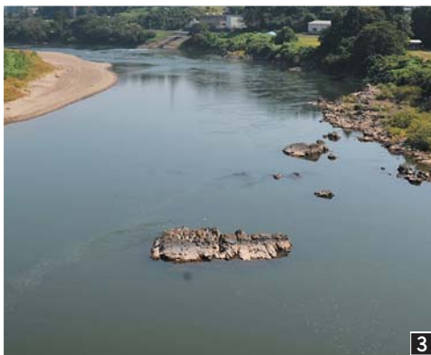
1 箱石橋とその名の由来である箱石 2 降水量の少ない年にはその姿を大きく現す 3 箱石橋から箱石の全容を眺めることができる