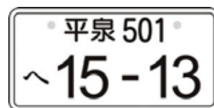
平泉ナンバーイメージ

ご当地ナンバーは、これまで全国の19地域で導入されておりますが、導入した地域における一体感の醸成や関係自治体間の連携の構築といった効果に加え、知名度アップによる地域振興や観光振興などの経済的効果についても一定の効果があったと評価されています。