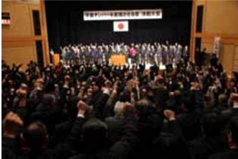
平成 23 年 1 月 平泉ナンバーを実現させる会 設立総会・決起大会