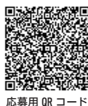
応募用 QR コード

国勢調査市実施本部（江刺総合支所・内線 521、〒023-1192 ※住所不要、 ✉ toukei@city.oshu.iwate.jp）