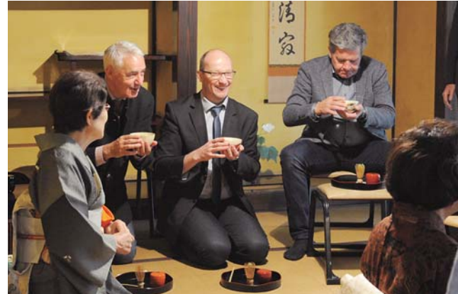
作法を教わりながら自分でたてたお茶の味はいかがでしたでしょうか？