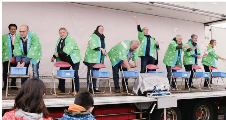
江刺産業まつりで餅まきを体験。「こっち！こっち！」と声を掛けられ、餅と一緒に笑顔もまきました。