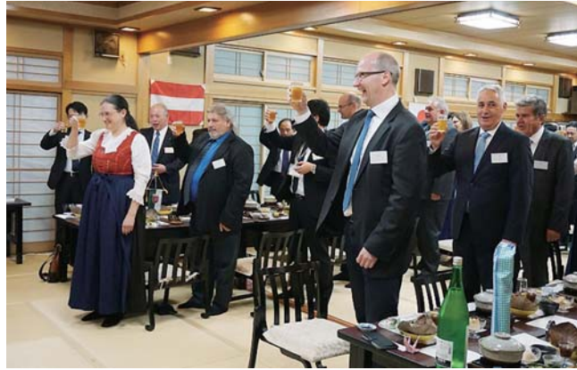
オーストリアの伝統衣装トラハトを着用して公式歓迎会に参加してください、会場は華やかな雰囲気。