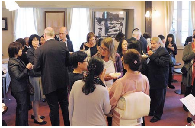
訪問団一行と市民約40人が英語・ドイツ語・日本語で交流を深めました。