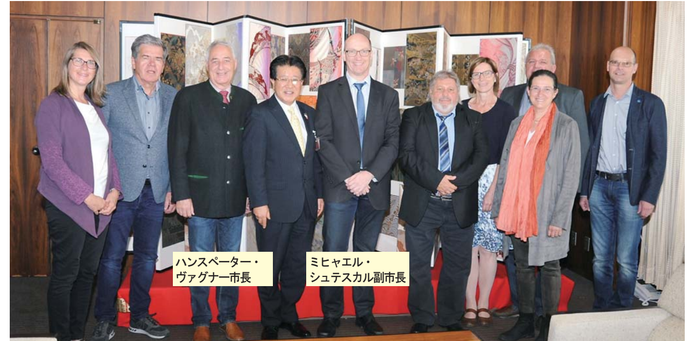
ハンスペーター・ ヴァグナー市長