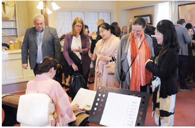
水沢地域交流館で行われた市民交流会。琴とチェロの演奏がオープニングを飾りました。